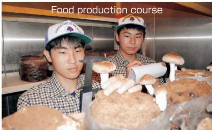
Food production course

稲作や野菜・果樹の栽培、肉牛の飼育やキノコ生産など、食料生産だけでなくマーケティングや6次産業化まで幅広く学びます。また、持続可能な農業の実現を目指し、循環型農業やスマート農業などにも取り組みます。