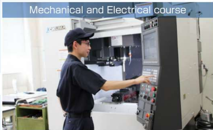
Mechanical and Electrical course

切削加工や溶接、マイコン制御や電気工事など幅広い技術を学べます。機械系・電気系どちらの資格も取得できます。課題研究では、3DCADでの設計、3Dプリンター、レーザー彫刻、IoT技術の活用など多彩な内容に挑戦！